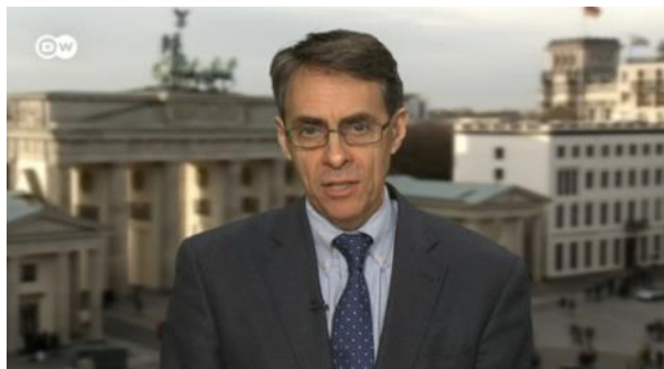
HRW-Direktor und CFR-Mitglied Kenneth Roth auf der Deutschen Welle

Im Syrienkrieg hatte Human Rights Watch nach dem Giftgasangriff vom Sommer 2013 alsbald ein Gutachten zur Hand, welches die Täterschaft der syrischen Regierung belegen und damit eine NATO-Intervention begründen sollte. Das Gutachten stellte sich in einer späteren Analyse von MIT-Forschern freilich als fabriziert heraus – für CFR-Medien wohl auch künftig kein Grund zur Skepsis.