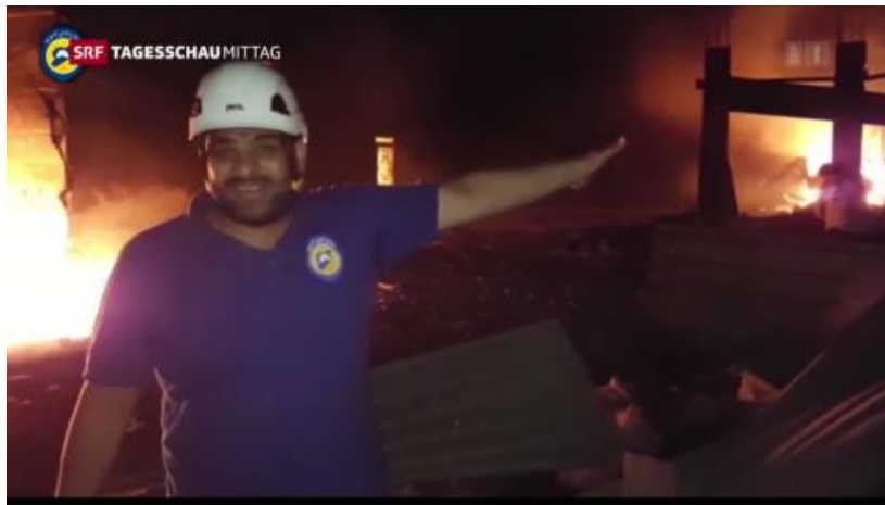
Ein Mitarbeiter der Weißhelme zeigt auf den UNO-Hilfskonvoi, der am 20. September 2016 in der Nähe von Aleppo unter ungeklärten Umständen ausbrannte, und beschuldigt Russland und Syrien.

Neben den permanenten NGOs wie Amnesty und HRW gründen und finanzieren CFR-geführte Institutionen wie USAID und NED für einzelne Konflikte bei Bedarf zusätzlich temporäre Organisationen, die lokale Aufgaben übernehmen und sich nahtlos in die Matrix einfügen lassen. In Syrien entstanden auf diese Weise etwa die Syrische Beobachtungsstelle für Menschenrechte , das Aleppo Media Center oder die berühmten Weißhelme , die die westlichen Agenturen und Medien mit dramatischen und nicht immer über alle Zweifel erhabenen Bildern und Informationen versorgen .