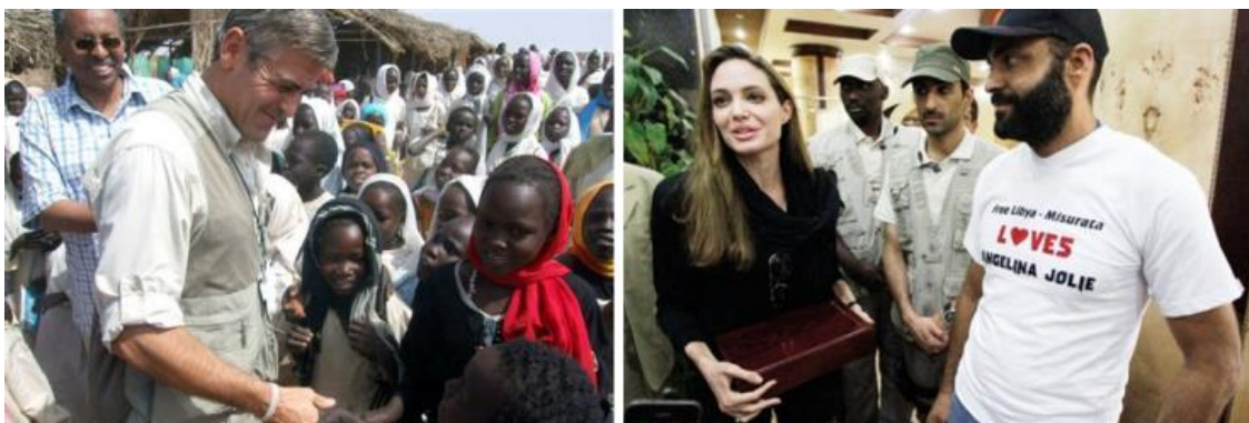
Clooney 2012 im (Süd-)Sudan, Jolie 2011 in Libyen.

Doch nicht nur Filmstudios, auch einige der bekanntesten Hollywood-Stars sind Mitglied im CFR und engagieren sich für dessen internationale Projekte. Wenn Angelina Jolie nach Libyen fliegt, um mit den NATO-Revolutionären Solidarität zu zeigen und sie für ihren Einsatz zu loben , oder wenn George Clooney sich (der hungernden Kinder wegen) für die Aufspaltung des (ölexportierenden und China-freundlichen) Sudans unter US-Aufsicht einsetzt , dann berichten CFR-Medien ausführlich darüber – und erwähnen dabei nur eines nicht: dass diese Schauspieler selbst Mitglieder des Councils sind.