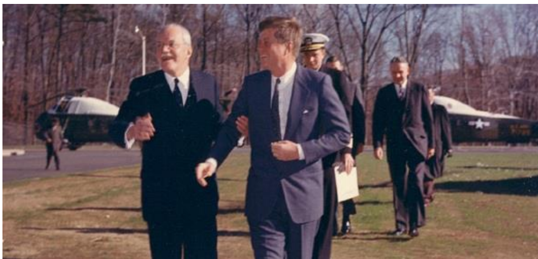
CIA- und CFR-Direktor Allen Dulles (links), der nach der gescheiterten Kuba-Invasion von Kennedy entlassen wurde und später die Untersuchungskommission zum Mord an Kennedy mitleitete.

Seit dem Zweiten Weltkrieg waren nahezu alle CIA-Direktoren Mitglieder des Councils. Bereits die Vorgängerorganisation der CIA, das Office of Strategic Services (OSS) , wurde von den CFR-Mitgliedern Allen Dulles und William J. Donovan gegründet und geleitet. Insofern dürfte die CIA eher als ein verdeckt operierender Arm des Councils zu sehen sein, und weniger als ein klassischer, ausschließlich dem US-Präsidenten unterstellter Geheimdienst.