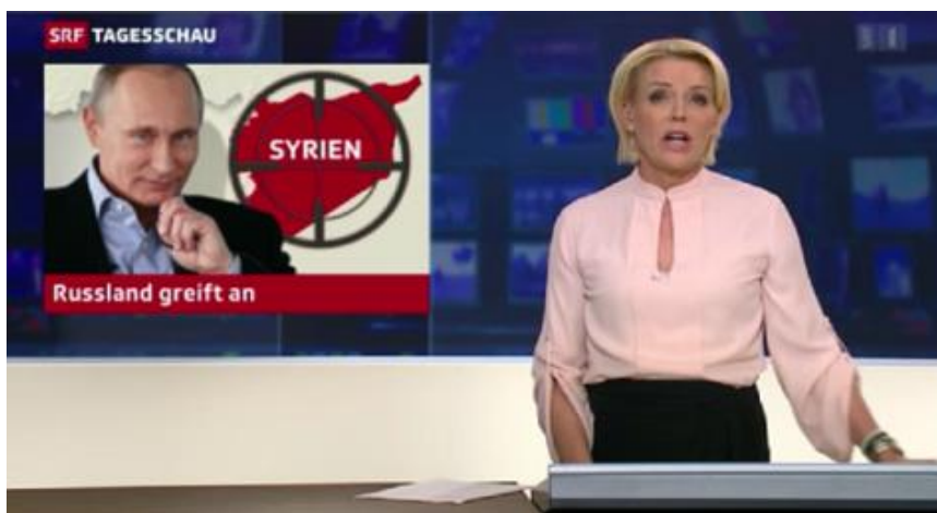
NATO-konform: Die Tagesschau des Schweizer Fernsehens SRF

In geopolitischen bzw. imperialen Angelegenheiten berichten mithin auch die etablierten Schweizer Medien weitgehend CFR- und NATO-konform . Begünstigt wird diese Konformität durch die zunehmende Medienkonzentration, die dazu führte, dass inzwischen über 90% des Schweizer Marktes von nur fünf Medienhäusern kontrolliert werden. Die strukturelle Einbindung dieser Verlage erfolgt dabei primär über die Bilderberg-Gruppe sowie über zunehmend enge Kooperationen mit deutschen Atlantikbrücke-Medien.