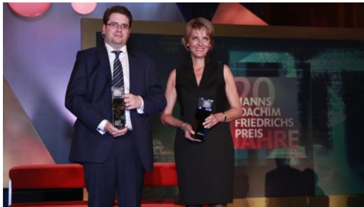
Bellingcat-Gründer Eliot Higgins und ZDF-Moderatorin Marietta Slomka erhalten 2015 den Hanns-Joachim-Friedrichs-Preis für herausragenden Fernsehjournalismus.

In den USA betrifft dies etwa die Brookings Institution , die RAND Corporation , den NATO-nahen Atlantic Council , das Aspen Institute oder das Center for Strategic and International Studies (CSIS) , die allesamt von CFR-Kadern geführt werden. Auch der Gründer des »investigativen Journalisten-Kollektivs« Bellingcat – das CFR-Medien in der Ukraine-Krise und im Syrienkrieg mit einschlägigen Analysen belieferte – tauchte als Senior Non-Resident Fellow beim Atlantic Council auf.