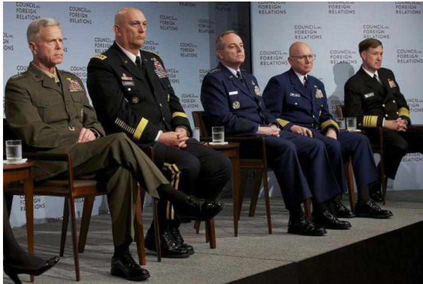
Mitglieder des US-Generalstabs auf einem CFR-Podium, 2013.

Die Symbiose zwischen Militär und Medien reicht somit weit über die berühmten »eingebetteten Journalisten« hinaus. Unabhängige Investigativ-Journalisten haben hingegen einen schweren Stand: Sie werden von NATO-Mitgliedern gemäß Wikileaks-Dokumenten als eines der größten Sicherheitsrisiken eingestuft – und entsprechend behandelt.