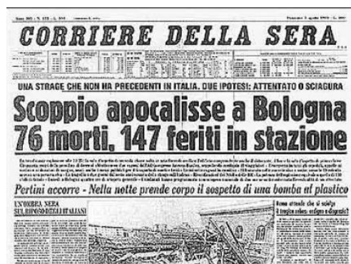
Anschlag auf den Bahnhof von Bologna, 1980: Eine Gladio-Operation

Das Besondere an Geheimdiensten wie der CIA ist indes, dass sie nicht nur in der Gewinnung und Verarbeitung von Information tätig sind, sondern auch verdeckte Operationen durchführen. So organisierten britische und amerikanische Geheimdienste zusammen mit der NATO während des Kalten Kriegs Dutzende Bombenanschläge in Westeuropa, die sodann kommunistischen und arabischen Gruppierungen angelastet wurden ( Operation Gladio ). CFR-Medien verbreiteten dabei stets das offizielle Narrativ und stellten keine kritischen Fragen – ein Mechanismus, der sich bis heute beobachten lässt.