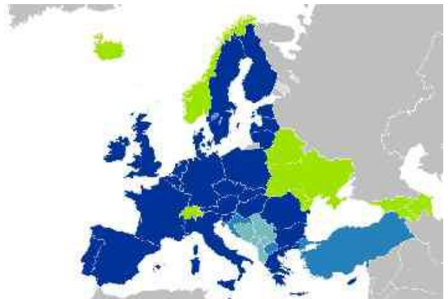
Abb. 3: Staaten der EU

So liegt er da zwischen der Nordsee und dem Mittelmeer, der große Drache. Gott ist allmächtig und auf allen Ebenen seiner Schöpfung souverän. Das gilt natürlich auch für die Geographie. Er hat es so eingerichtet, dass er dem Reich des Drachen auf der Erdoberfläche auch genau die Form eines Drachen gegeben hat.