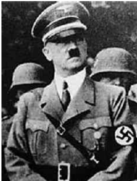
Abb. 9: Hitler

Ein letztes Kriterium ist die totale Entwaffnung der Zivilbevölkerung und der Armeen aller Nationen mit Ausnahme der UNO-Truppen. Sie führt dazu, dass der Bürger nicht mehr dazu in der Lage ist, sich selbst oder seine Familie gegen eventuelle ungerechte, brutale oder sogar grausame Maßnahmen der Regierung zur Wehr zu setzen. Er wird nur noch mit erhobenen Händen herauskommen können. Widerstand ist zwecklos, das Gebäude ist umstellt.