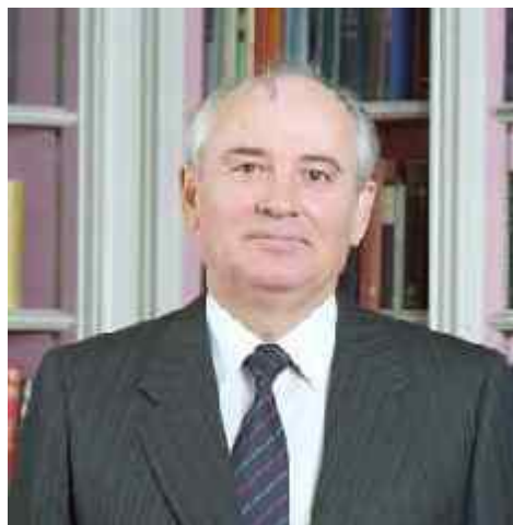
Abb. 6: Gorbatschow

Manche Ausleger der Bibel haben Gog mit dem ehemaligen russischen Präsidenten Michail Gorbatschow identifiziert. Michail Fjodorowitsch Gorbatschow wurde am 02.03.1931 in dem Dorf Privolnoye in der Region Stavropol geboren. Die Vorfahren Gorbatschows trugen vor der russischen Revolution den Namen Gogrbachev (Christian Newsletter Prophecy in the News, November 1989), der die Silbe Gog enthält. Die Region Stavropol ist identisch mit dem Gebiet, das in der Bibel als das Land Magog bezeichnet wird. Da Gorbatschow natürlich auch als ehemaliger Präsident der UDSSR bekannt ist, könnte man ihn demnach als einen König von Russland bezeichnen.