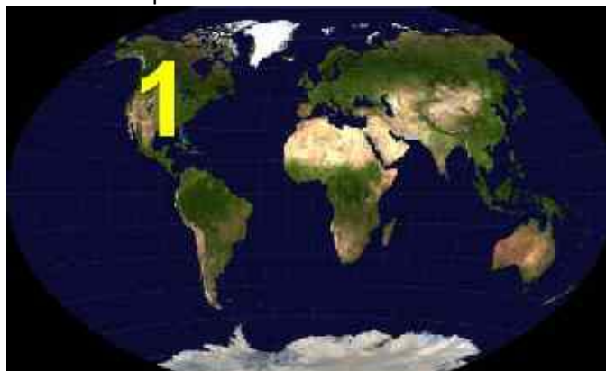
Abb. 5: Reich 1

Fakt ist, dass man mit Skalarwaffen Erdbeben, Tsunamis und Hurrikans zu jeder beliebigen Zeit an jedem beliebigen Ort erzeugen kann (siehe den entsprechenden Abschnitt). Am 04.Juli 1976, also am 200. Nationalfeiertag der USA, machten die Sowjets den Amerikanern ein besonderes Geschenk. Sie aktivierten nämlich im Erdinneren mittels ihrer Technologie ein skalares Signal, den so genannten Specht oder Woodpecker. Seit nunmehr 34 Jahren erweicht dieses Signal, das von den Amerikanern nicht gestoppt werden kann (weil sie die Technologie nicht kennen), systematisch den Untergrund der Caldera. Der Boden des Sees hat sich bereits beträchtlich angehoben, sodass ein Ausbruch kurz bevorsteht. Es ist möglich, den Ausbruch genau zum gewünschten Zeitpunkt herbei zu führen!