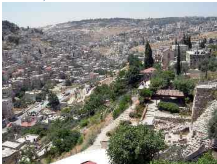
Abb. 13: Kidrontal

Der Ölberg wird sich spalten zu einem großen Tal, in das die letzten gläubigen Juden Jerusalems hinein fliehen werden ( Sacharja 12 und 14 ).