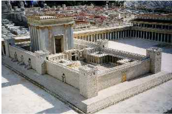
Abb. 10: Modell des Tempels

Ich habe mich wiederholt gefragt, wieso denn die Orthodoxen einem Messias vertrauen werden, der ihnen einen Frieden von lächerlichen sieben Jahren anbieten wird. Jeder Jude, der das Alte Testament kennt, weiß doch, dass das Reich des Friedefürsten ein ewiges Reich sein wird (Daniel 7, 14 und andere Stellen). Folgende Antwort auf diese Frage erscheint mir möglich. Dies ist meine persönliche Vorstellung und sollte nicht als biblische Lehre gelten. Ich glaube folgendes: