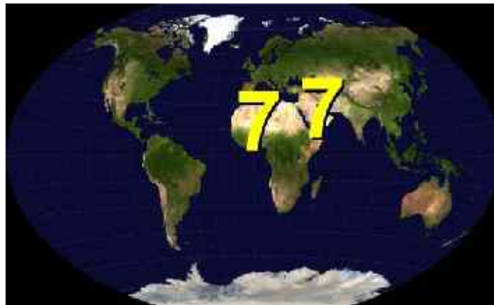
Abb. 2: Region 7

Römischen Reiches. In heutiger Zeit entspricht dieses Gebiet der EU. Israel hat bereits heute eine starke politische Bindung an die EU. Der Antichrist wird also aus diesem Gebiet stammen. Auch das Konzept einer Mittelmeerunion, wie es vom französischen Präsidenten Sarkozy ( sein Name bedeutet: „der aus Syrakus“ ) propagiert wird, könnte hierzu passen. Das Gebiet wäre dann genau identisch mit dem alten Römischen Reich, weil auch Nordafrika noch mit dazu gehören würde. Nordafrika hat allerdings in unserer Zeit keinen Herrscher von der Statur und dem Einfluss, den der Antichrist haben wird. Deshalb wird er aus Kerneuropa stammen, meines Erachtens aus dem britischen Königshaus.