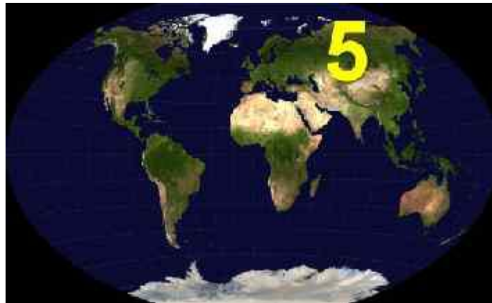
Abb. 7: Reich 5

Die russische Koalition wird Israel plötzlich angreifen, um sich der Reichtümer des Landes zu bewältigen. Für Gog und Russland wird es einerseits um das Öl und das Gold gehen, das Großisrael den Arabern abgenommen hat. Die gewaltige Erweiterung der geostrategischen Macht Russlands im Mittelmeerraum und im gesamten Mittleren Osten wird das zweite Hauptmotiv sein. Global gesehen wird Russland drittens auch die Vorherrschaft gegenüber China anstreben, also letztlich die Weltmacht des russischen Kommunismus. Von diesem Ziel haben alle russischen Diktatoren und Präsidenten seit der Oktoberrevolution von 1917 geträumt. Jetzt endlich wird Gog glauben, dass der geeignete Zeitpunkt zum Großangriff auf Israel gekommen sei.