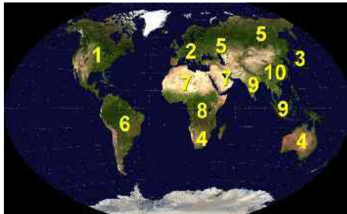
Abb. 1: Die 10 Reiche

Alles was bisher in der neuzeitlichen Weltgeschichte seit dem 16. Jahrhundert abgelaufen ist, gehörte also zu den Vorbereitungen für das antichristliche Weltreich. Die Vollendung wird kommen, wenn der geplante Weltherrscher in Person öffentlich auftreten wird. Das wird nach meiner Ansicht wie bereits gesagt am Ende des kommenden dritten Weltkrieges geschehen. Um also unsere Frage nach dem zeitlichen Anfangspunkt des antichristlichen Weltreiches zu beantworten, kann gesagt werden: Es wird der Moment sein, in dem der Antichrist (wahrscheinlich am Ende des dritten Weltkrieges) persönlich an die Öffentlichkeit treten wird. Er wird zunächst die Herrschaft über Israel antreten, später die Herrschaft über die ganze Erde.