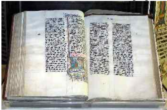
Abb. 12: Die Bibel

Er wird den Hilferuf der Juden in Petra erhören. Er wird direkt aus dem Himmel über Paran (Nordostsinai) und Teman nach Edom kommen ( Habakuk 3,3-15 ) und die Juden von Bozra/Petra ( die Hütten Judas nach Sacharja 12,7 ) zuerst erretten. Er wird vor den befreiten Juden aus Bozra/Petra herausziehen als der große Durchbrecher der feindlichen Linien ( Micha 2,12-13 ). Dann wird er das gesamte Land Edom auf ewig vernichten. Das wird für die dort noch lebenden Palästinenser den endgültigen Untergang bedeuten.