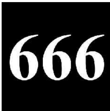
Abb. 8: Zahl des Tieres

Das Kreditkartenwesen und die Kontoführung im Computer werden weltweit flächendeckend und lückenlos eingeführt werden, und das wird sehr schnell gehen. Die Menschen werden dieses System ebenfalls erst einmal dankbar akzeptieren, weil es zunächst das Ende des weltwirtschaftlichen Chaos bedeuten wird. Ähnlich war es 1933 in Deutschland. Nach den fürchterlichen wirtschaftlichen Erschütterungen Deutschlands, die durch die exzessiv überhöhten Reparationsforderungen der Sieger nach dem ersten Weltkrieg absichtlich herbeigeführt worden waren, begrüßten die ausgehungerten, verarmten und arbeitslosen Menschen der schwachen Weimarer Republik mit Begeisterung den Erlöser Adolf Hitler. Was sie nicht wussten war die Tatsache, dass dieser Hitler von denselben Westmächten installiert und finanziert worden war, die bereits den ersten Weltkrieg mit allen seinen Folgen absichtlich inszeniert hatten. Nach einer Zeit von falschem Frieden und wirtschaftlicher Erholung mit Vollbeschäftigung und erneuter exzessiver Aufrüstung (ebenfalls von den Westmächten USA, England und Schweiz finanziert) brach Hitler den zweiten Weltkrieg vom Zaun. All dies war seit langer Zeit im Voraus geplant (siehe Weltgeschichte).