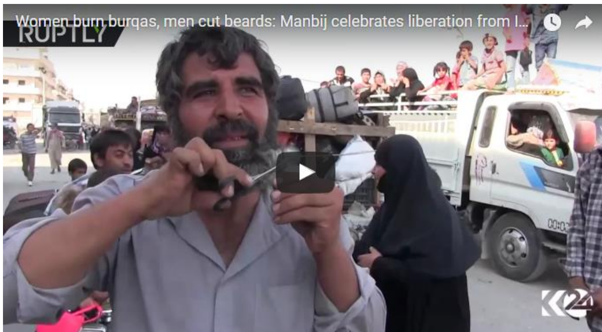
Zum Anschauen des Videos auf das Bild klicken (youtube)

Im vergangenen Jahr hatten sich bereits Frauen in Manbij ihre Burkas heruntergerissen, während Männer sich ihre Bärte abschnitten, als sie sich über ihre neu gewonnene Freiheit freuten, nachdem die Syrischen Demokratischen Streitkräfte die Terroristen aus ihrer Stadt vertrieben hatte.