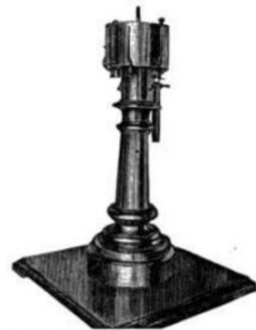
TESLA'S OSCILLATOR AS SHOWN AT THE COLUMBIAN EXPOSITION.

Im Jahre 1898 behauptete Tesla, er habe eine kleine oszillierende Vorrichtung gebaut und eingesetzt, die, wenn er sie in seinem Büro anschloss und betrieb, fast das Gebäude und alles um ihn herum schüttelte. Mit anderen Worten, das Gerät könnte angeblich Erdbeben simulieren. Als er die potenziellen Schrecken zu erkennen begann, die ein solches Gerät schaffen könnte“, sagte Tesla, er habe einen Hammer genommen, um den Oszillator zu deaktivieren und habe seine Mitarbeiter angewiesen, sich über die Ursache des Bebens unwissend zu geben, wenn sie befragt würden.“ Einige Theoretiker glauben, dass die US-Regierung weiterhin Tesla's Forschungsergebnisse an Orten wie der HAARP-Anlage (ein Hochfrequenz-Forschungsprojekt in der Ionosphäre) in Alaska verwendet.