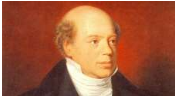
Nathan Mayer Rothschild

Der dritte Sohn, Nathan, wurde der größte Erfolg im Ausland eigen, er handelte für Könige, finanzierte die Infrastruktur, befreite nationale Banken und startete die industrielle Revolution. Der internationale Finanzsektor wurde geboren.