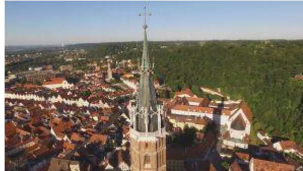
Original Luftbildaufnahme mit Kameradrohne

Und hier nochmal Google Earth aus derselben Perspektive: