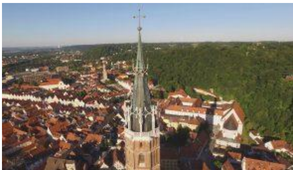
Original Luftbildaufnahme mit Kameradrohne

Und hier nochmal Google Earth aus derselben Perspektive: