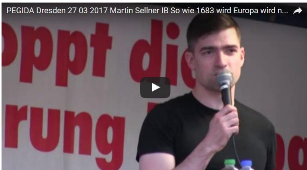
Zum Anschauen des Videos auf das Bild klicken (youtube)

Sellners Rede ist in höchstem Maße hörens Wert. Sie wird eines Tages an den Schulen zur Pflichtlektüre gehören. Doch davor gilt es, in einer konzertierten großen Anstrengung die beiden tödlichsten Feinde der europäischen Zivilisation für immer zu vertreiben: den Islam und den Sozialismus.