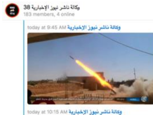
Screenshot vom Telegram-Konto der Nachrichtenagentur Nashir

Am besorgniserregendsten jedoch ist, wie leicht zugänglich diese Kanäle geworden sind. IS ist dafür bekannt, seine Opfer-Rekruten zu präparieren und durch eine Gehirnwäsche glauben zu machen, dass ein Beitritt zu ISIS die Sache wert ist. Wenn man sich den Inhalt anschaut, dann ist klar, dass sie versuchen, das „gute Leben“ von ISIS zu zeigen. Männer halten lächelnd ihre Maschinengewehre, Fotos von scheinbar glücklichen Männern, die Nahrung oben auf einem Hügel teilen, und lange Abschiede von ihren Märtyrerfreunden, die Selbstmordangriffe ausführten. Man kann sehen, wo in einem anfälligen potentiellen Rekruten die „Ist doch gar nicht so schlimm wie jeder sagt“-Mentalität einsetzt. Das hat sich schon so oft bewährt bei jungen Westlern, die sich dann ISIS anschlossen. Einige stehlen die Kreditkarten ihrer Eltern und verlassen das Gymnasium, fliegen rund um den Globus, nur, um einen IS-Kämpfer zu treffen, den sie online kennengelernt haben.