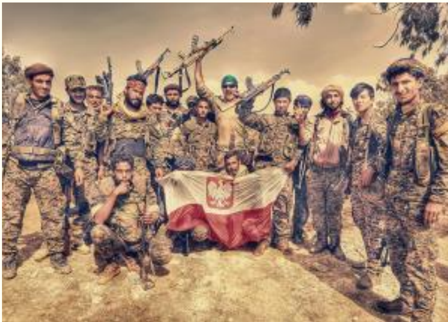
Mitglieder der SFD (Demokratischen Kräfte Syriens), die gegen den IS gekämpft haben, zeigen die polnische Fahne, Quelle: Facebook